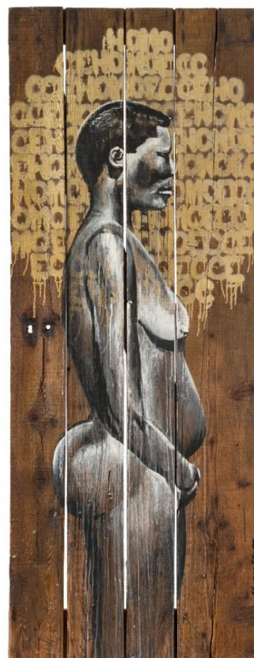
Sarah (2019) Acrylique et aérosol sur bois 200 x 100cm.