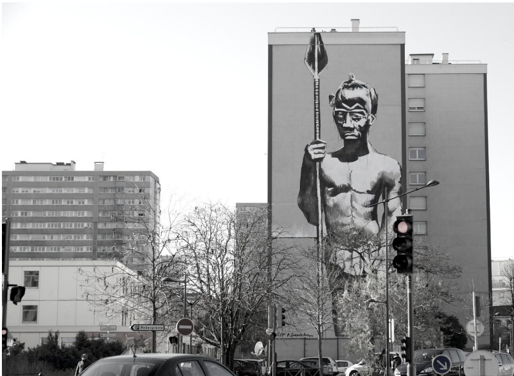
Guerrier Bantu, Vitry-sur Seine, 2013

Autour de ses thèmes de prédilection, une trentaine d'œuvres sont exposées à l'Espace Paul Rebeyrolle et reproduites dans le catalogue de l'exposition.