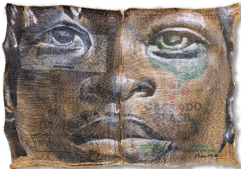
Orphéo (2019) Acrylique et aérosol sur toile de jute 101 x 138 cm.