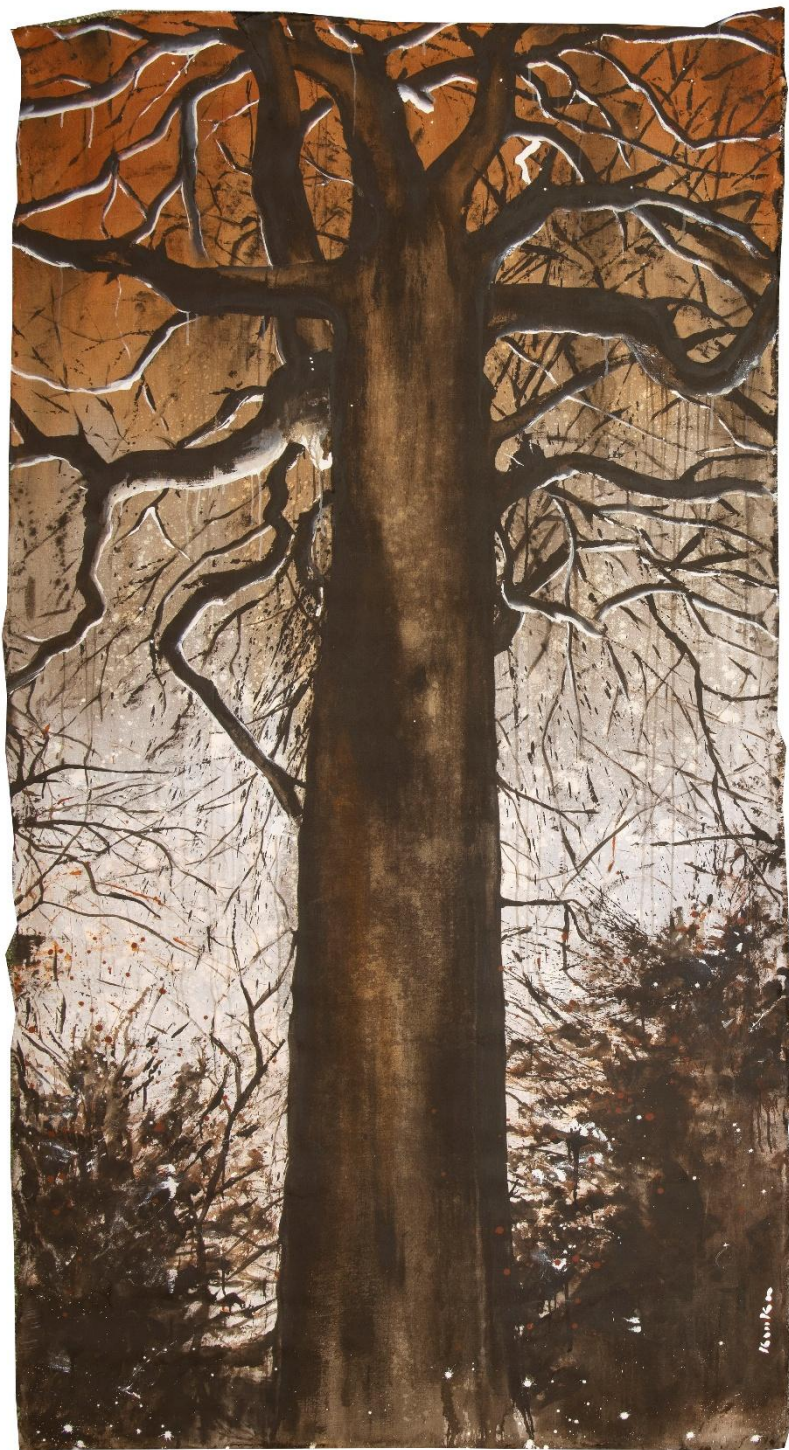
Arbre à palabres (2026) Acrylique sur lin 305 x 150 cm.