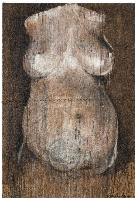
Cicatrice (2018) Acrylique sur toile de jute 130 x 89 cm.