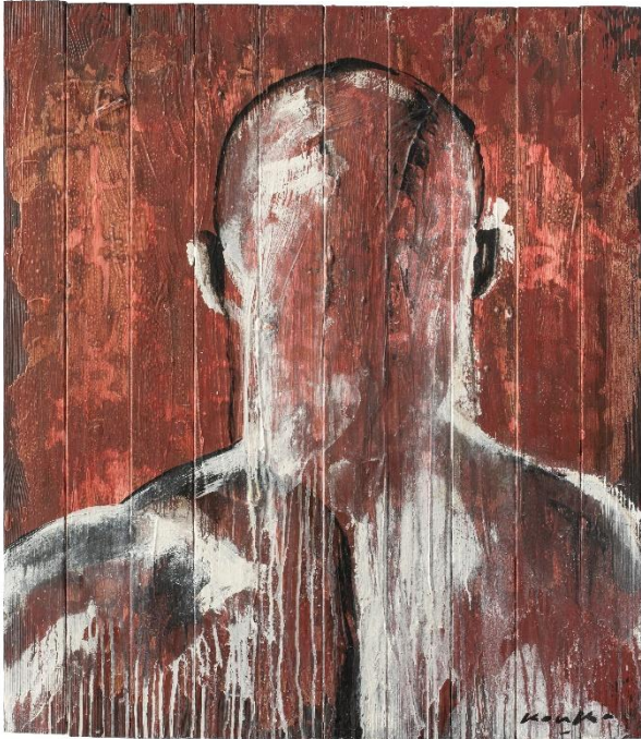
Face à l'abîme (2018)

Acrylique et aérosol sur bois 80 x 70 cm.