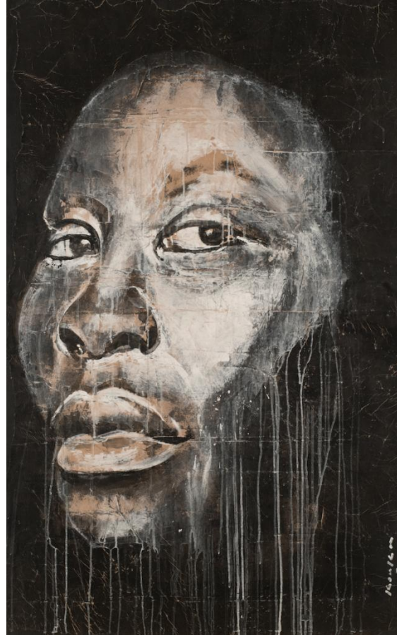
Marianne (2021) Acrylique sur papier maroufflé sur toile 146 x 89 cm.