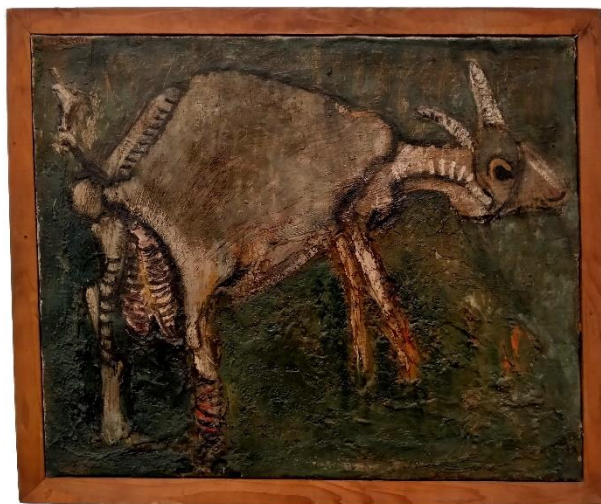
La Chèvre (1948), 50 x 61 cm.

Figurez l'animal, pelage ou plumage, avec de la peinture épaisse, parfois mêlée d'herbe ou de petites plumes.